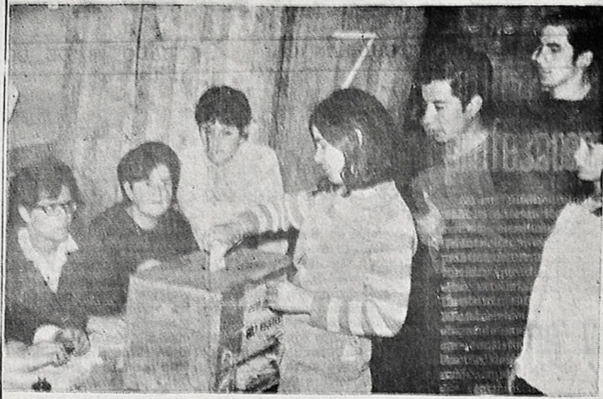
La foto capta un aspecto de la votación para designar nueva directiva del Centro de Alumnos de la U. de Chile-Chillán.