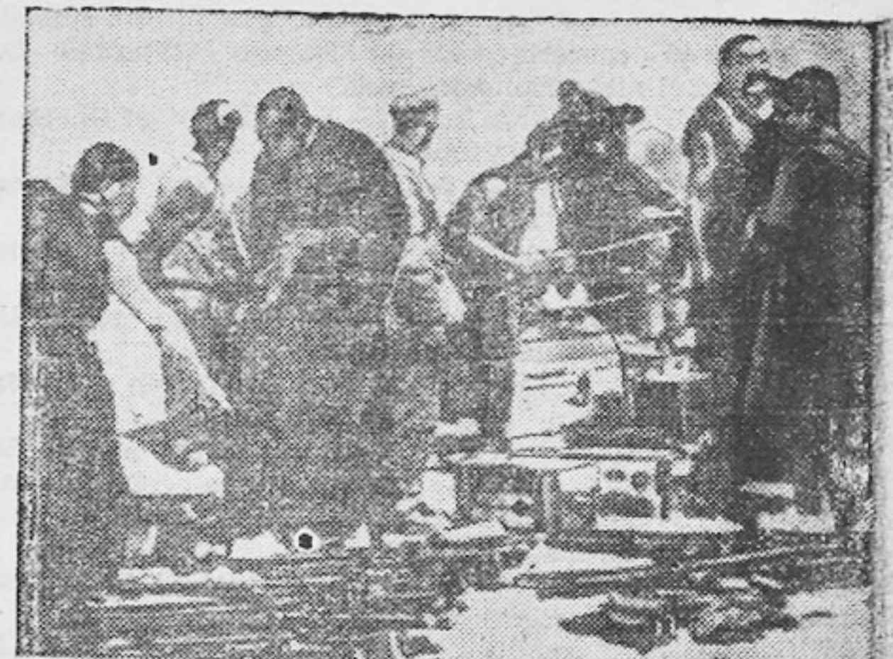
UN GRUPO de rebeldes tibetanos (arriba), rinde sus armas a las tropas comunistas chinas en Lhasa, durante la ofensiva roja para reprimir la rebelión que surgió en el montañoso país. Abajo, jóvenes de Lhasa se reúnen para discutir un edicto de Peiping.